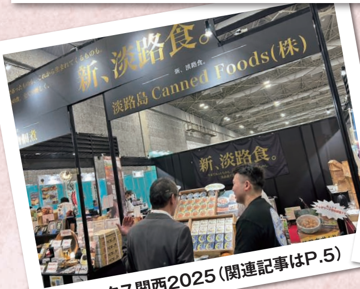
ファベックス関西2025(関連記事はP.5)