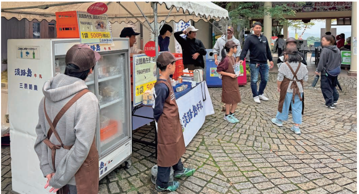
【青年部】小学生ワーキングチャレンジ in イングランドの丘(関連記事はP.4)