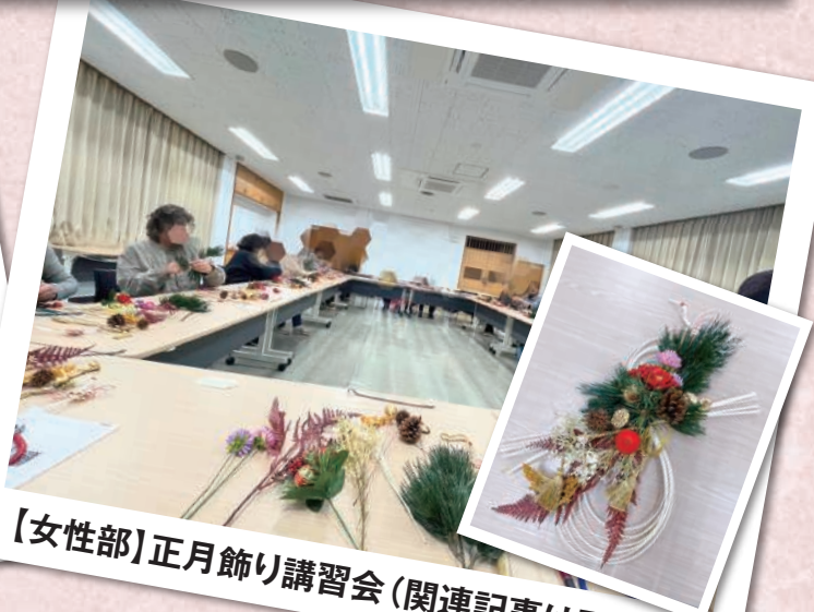
【女性部】正月飾り講習会(関連記事はP.8)