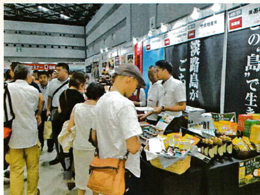
全国食の逸品EXPO展示会の様子