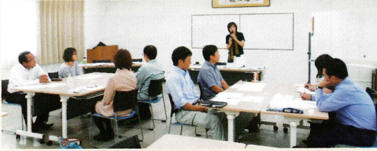
経営者・管理職向けコミュニケーション力向上セミナー風景