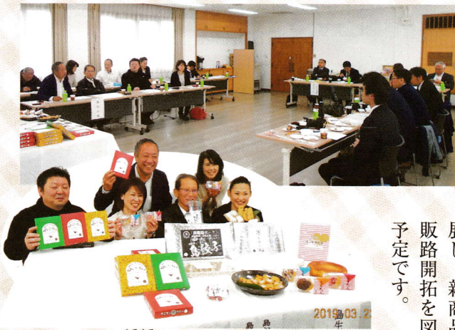
「島○○」商品の完成報告会

平成30年度事業として、「淡路島の地域資源を活用したプレミアム商品の開発を目的に毎月会議を重ね、「島○○」 まるまる と云うネーミングで統一した商品を作製していく方向に決定し事業を進めてきました。商品完成に伴い新聞社等へのプレスリリースを行い、3月22日に商品完成報告会を開催し3社の新聞社と市役所広報の取材を受けました。新聞への掲載もあり知名度向上に繋がりました。令和元年度では、「全国 食の逸品 EXPO」に出展し、新商品の販路開拓を図る予定です。