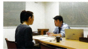
平成29年度個別相談状況

開催日時：9月20日～10月25日 毎週木曜日の午後1時から午後5時まで (1人1時間程度) 完全予約制で1日定員4名となります。 場所：南あわじ市商工会 1F相談室 内容：創業・経営に関する相談を個別に専門家が対応します。