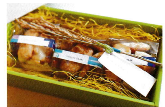
◎幸せ祈る稲穂入りおかきセット