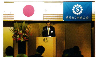
第13回 南あわじ市商工会通常総代