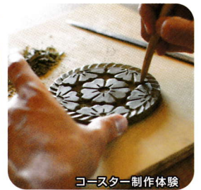
コースター制作体験