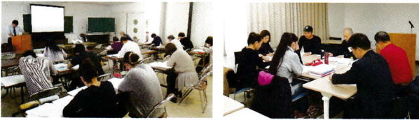
平成29年度創業セミナー状況

開催日時：9月6日～10月11日 毎週木曜日の午後6時半から午後9時半まで(1日3時間) 場所：南あわじ市商工会 2F大会議室 内容：創業に必要な経営・財務・販路開拓等に関する講座 対象者：これから創業を予定している方・学生や主婦など創業に興味のある方 今の事業を活かして新たなビジネスチャンスを見つけたいシニアの方 淡路島内の地域資源を活かして 創業したい方 定員：25名 受講料：無料