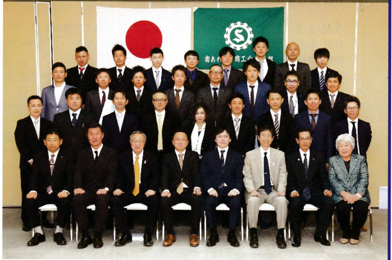
4月13日(金)慶野松原荘にて