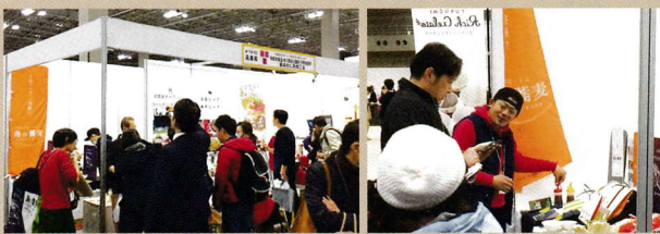
グルメ&ダイニングスタイルショー春2018