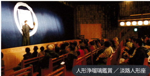
人形浄瑠璃鑑賞 / 淡路人形座