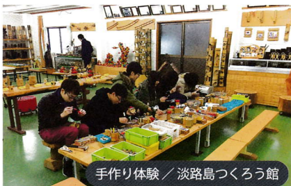
手作り体験 / 淡路島つくり館