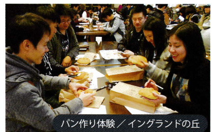
パン作り体験 / イングランドの丘

2日目は、市内の体験・見学施設をグループ毎に体験していただきました。皆様には、大変楽しんでいただくことができました。参加者の中には、もう少し時間が欲しいとの意見もあり、今後に繋がる貴重なご意見をいただきました。