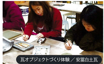
瓦オブジェクトづくり体験 / 安富白土瓦