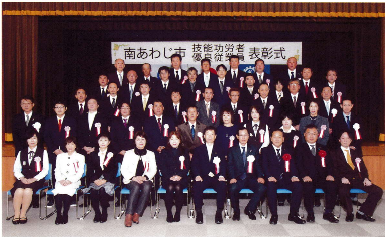
勤続20年以上 敬称略 勤続10年以上 敬称略