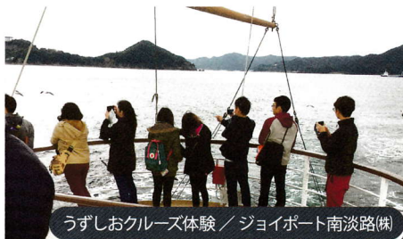
うずしおクルーズ体験 / ジョイポート南淡路(株)