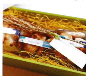
◎幸せ祈る稲穂入りおかきセット