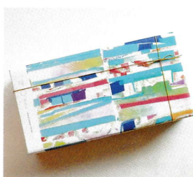
◎おかきのパッケージデザイン

淡路島の素材にこだわって、からだに優しくて、食べると「ほっこり」するような…。そんな「おかき」をお届けしたいと、一年かけて準備をし、やっと生まれました。(試験販売中)