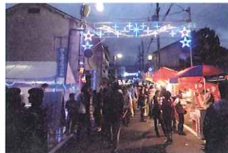
暖かなイルミネーション

一昨年から「賑わい創出事業」との 合同開催となり、町行 政・観光協会・商店街 が一体となって集客 事業に取り組んでい る。駅前商店街のイ ルミネーションの数 も更に増え、賑わいを 演出している。