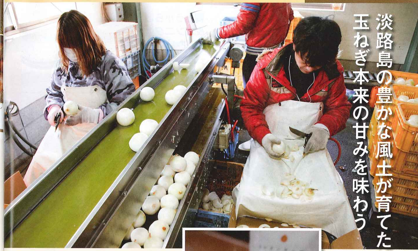
玉ねぎの薄皮をむき、頭と根の部分を取り除く作業シーン。 ※注:写真の玉ねぎは淡路島産のものではありません。