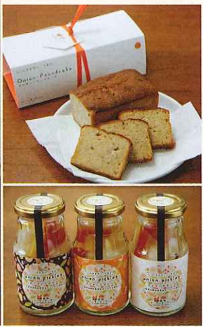
商品ラインナップ。上はパウンドケーキで、下が新発売のピクルス。