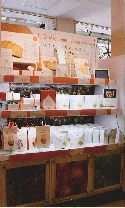
道の駅「うずしお」では、専用コーナーを設けて好評販売中。