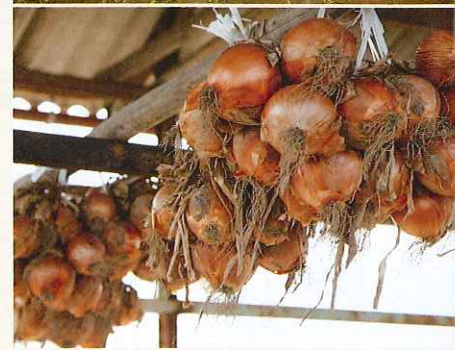
上/三原平野に広がる玉ねぎ畑。収穫は5〜6月頃でまだ成熟中(撮影時は2月)。下/収穫した玉ねぎは陰干ししてさらに熟成。